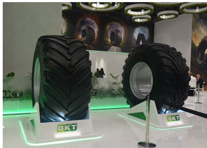
Agrimax Proharvest VF (a sinistra) e Ridemax FL 615

Allo stand spiccava anche la presenza dell'iconico trattore in plexiglass, che su entrambi gli assi equipaggia uno dei prodotti di punta della multi-