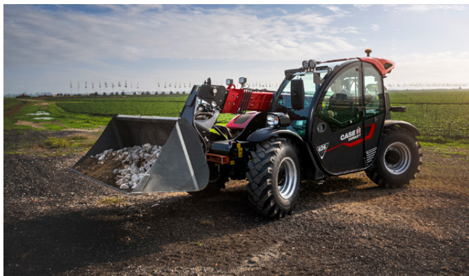
Il FarmLift 626 è lungo poco più di 4 m, alto 1,93 m e largo 1,89 m, con un raggio di sterzo di soli 3,25 m

ridotto per facilitare il lavoro in azienda e un'altezza complessiva inferiore per un migliore accesso a porte basse. Il FarmLift 626 è quindi adatto a un'ampia gamma di applicazioni nelle aziende zootecniche e in molte altre imprese.