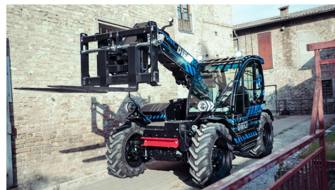
MiniAgri-e, in anteprima assoluta all'Eima

Retrocompatibile con i telescopici già in commercio e modulabile in base alle specifiche esigenze aziendali, Fast Attach offre agli operatori ulteriori vantaggi pratici, assicurando maggiore: