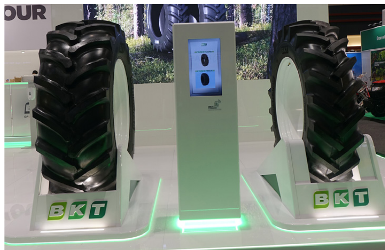
Le due novità per l'agroforestale: Forestland (a sinistra) e Forestmax