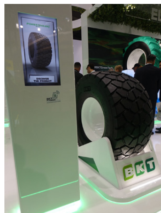
Nuovo radiale all-steel Powertrailer SR 331