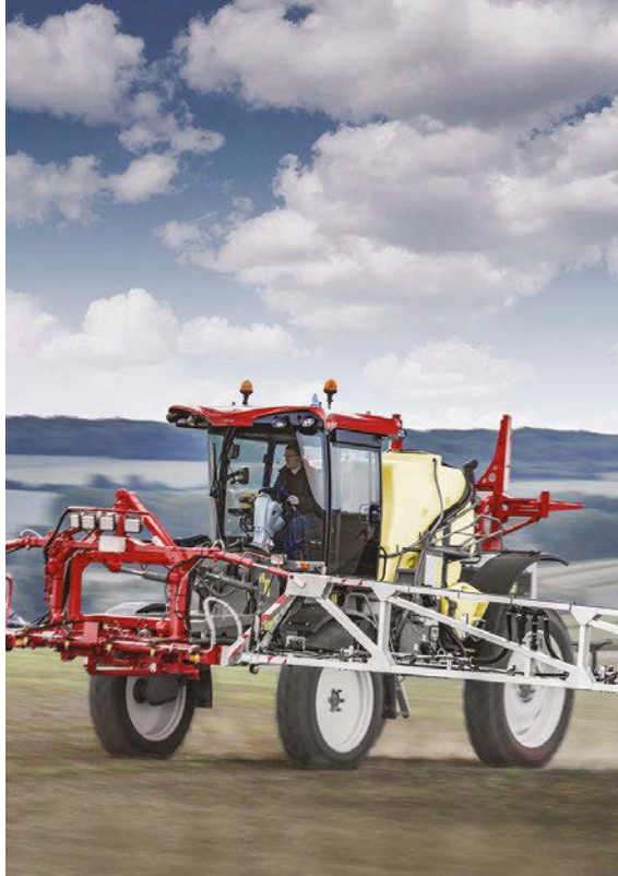
La nuova irroratrice semovente Hardi Hellios.

Recentemente è stata presentata la nuova irroratrice semovente Hardi Hellios, con capacità di 3.000 litri e barre in alluminio anteriori alla macchina, che spaziano dai 21 fino ai 38 metri di larghezza lavorativa. Compatta e versatile, grazie al suo peso contenuto e al motore di 170 cv di potenza, ben si presta alle realtà dell'agricoltura Italiana con un ottimo bilanciamento dei pesi. Tutti i polverizzatori portati e trainati della Hardi possono essere gestiti tramite il terminale virtuale Isobus del trattore. Il cliente può ordinare un polverizzatore Hardi con tecnologia Isobus e utilizzare le funzioni di distribuzione (controllo automatico delle sezioni "Auto Section Control") e di gestione del polverizzatore direttamente dal terminale Isobus della trattrice. Inoltre, è possibile