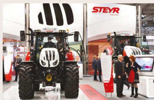
Il Profi Cvt 4145 con il nuovo cambio S-Control 8 lanciato ad Agritechnica.

Per quanto riguarda il cambio S-Control 8, offre 24 marce suddivise in 3 gruppi, sia in avanti sia in retromarcia, e dispone di diverse funzioni automatiche. Grazie al consumo di carburante di appena 258 g/kWh nel Dlg-PowerMix, sostiene la casa austriaca, il nuovo Steyr 4145 è il più efficiente della sua categoria. Il gruppo A, specificamente progettato per i lavori gravosi, copre velocità fino a 10,7 km/h e il suo funzionamento è simile a quello del gruppo B, concepito per le applicazioni in campo, per la fienagione e con caricatore frontale per velocità comprese tra 4,3 e 18,1 km/h, anche a pieno carico e con variazioni di velocità. Su strada, la trasmissione inizia direttamente dal gruppo C, quello più veloce. Sul campo, la trasmissione innesta automaticamente tutte e 8 le marce del gruppo A o B. Su strada, la trasmissione innesta automaticamente le 16 marce dei gruppi B e C.