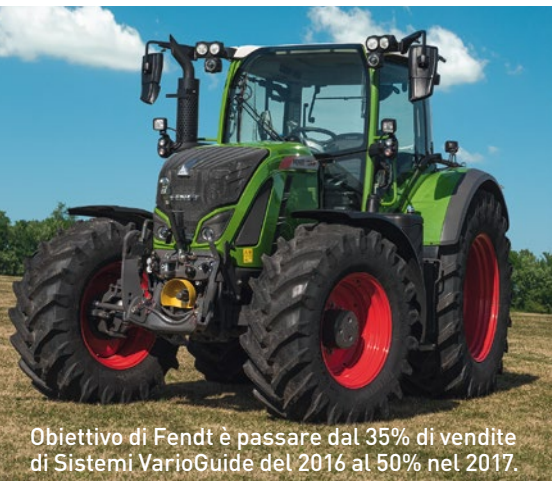
Obiettivo di Fendt è passare dal 35% di vendite di Sistemi VarioGuide del 2016 al 50% nel 2017.

Per maggiore sicurezza e comfort è disponibile un azionamento idraulico anche per il lato destro, ad es. per il comando del terzo punto idraulico. L'azionamento esterno della valvola nel Fendt 300 Vario è disponibile a