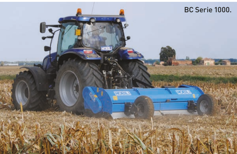
BC Serie 1000.