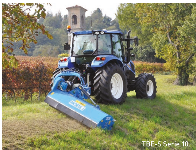
TBE-S Serie 10.

Passando alle trince, una prima novità è rappresentata dalla trincia laterale SLS , disponibile nelle larghezze di lavoro di 160 e 190 cm, progettata per la gestione di bordi e scarpate stradali e accoppiabile ai trattori sia anteriormente sia posteriormente. È l'unica sul mercato, sostiene Nobili, che abbina tutti i movimenti idraulici della testata presenti sulla macchina al fatto che tutte le operazioni per spostare la macchina dalla posizione anteriore a quella posteriore (e viceversa) si possono compiere in campo, senza utilizzo né di utensili, né di organi di sollevamento, in un tempo di 1,5-2 minuti con un solo operatore e di circa 30 secondi con due operatori. Le TBE e TBE-S serie 10 , invece, sono trince laterali con braccio a parallelogramma, ideali per la manutenzione del paesaggio, di argini e di aree verdi. Mantengono le caratteristiche di punta delle sorelle più grandi TBE e TBE-S serie 102. Lo spostamento laterale permette di ottenere una trinciatura in posizione laterale più omogenea. Queste trince sono adatte a trattori con potenze da 60-110 hp e disponibili nelle larghezze di lavoro di 160, 190 e 220 cm.