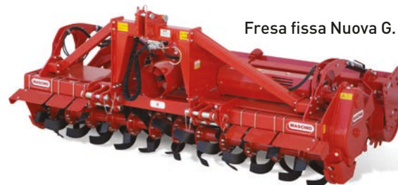
Fresa fissa Nuova G.

N ovità in tutti i settori di interesse per il gruppo di Campodarsego (Pd). Ne segnaliamo solo alcune e cominciamo dal settore della lavorazione del terreno con nuova G , la seconda generazione della fresa fissa Maschio. Più leggera, ma adatta a lavorazioni impegnative e utilizzabile con potenze da 180 fino a 270 cv, la fresa G garantisce un ottimo letto di semina a partire da qualsiasi condizione iniziale del terreno, ma dimostra appieno le proprie potenzialità durante gli impieghi più gravosi, come le lavorazioni dirette su terreni pesanti. Disponibile in tre larghezze di lavoro (300-350-400 cm), opera a una profondità di lavoro di 30 cm. Nel comparto dei coltivatori a dischi arriva Veloce , compatto e leggero, la dischiera perfetta per la gestione del residuo e per la preparazione del letto