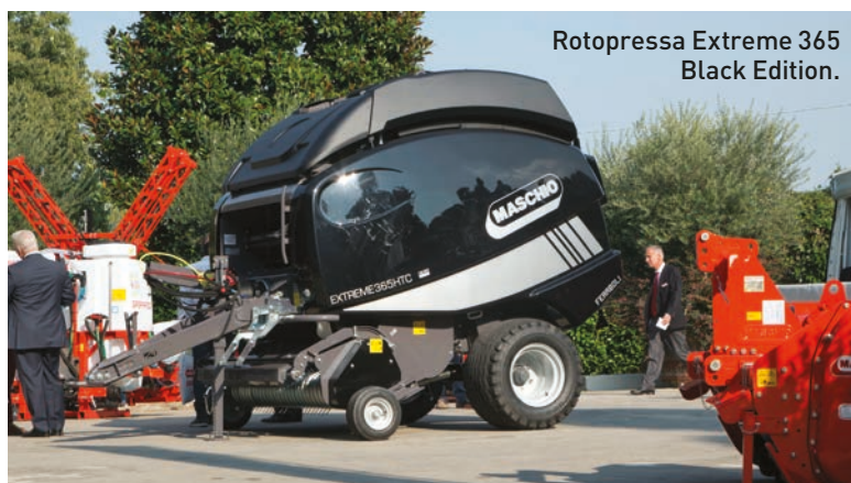
Rotopressa Extreme 365 Black Edition.

Passando alle seminatrici, la combinata Corona si presenta con una nuova barra di semina, chiamata XForce . La dischiera aggressiva, il rullo gommato da 1.050 mm, uniti alla nuova barra di semina rinforzata XForce (dotata di Silent Block), le permettono di adattarsi a ogni condizione di lavoro. Disponibile con tecnologia Isobus e in tre larghezze di lavoro (300 cm fissa-400 cm fissa e pieghevole-600 cm pieghevole), richiede potenze di 130-200 cv nella versione fissa e 180-300 cv nella versione pieghevole.