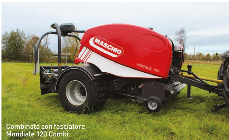
Combinata con fasciatore Mondiale 120 Combi.

Chiudiamo con la difesa e con le barre della nuova serie 900 per le irroratrici Campo, con larghezze fino a 36 metri ed elevata capacità operativa con capienza da 4.500 (Campo 44) a 6.600 litri (Campo 65). Massima uniformità di distribuzione grazie al nuovo centrale, ridisegnato per assorbire le imperfezioni del terreno e tenere sempre la barra libera nei movimenti e reattiva nel riposizionarsi. Sono disponibili come optional il controllo dei singoli ugelli (Seletron) e la tecnologia Isobus, per disporre della massima tecnologia, il tutto direttamente gestibile dal monitor del trattore. 🚗