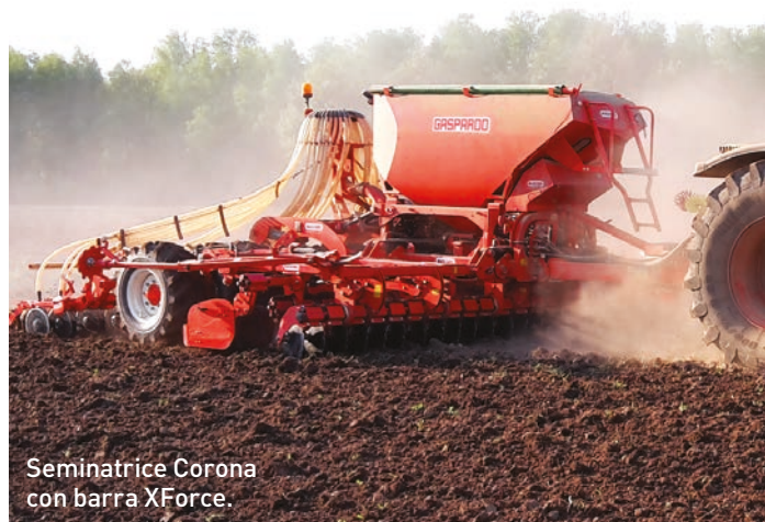
Seminatrice Corona con barra XForce.