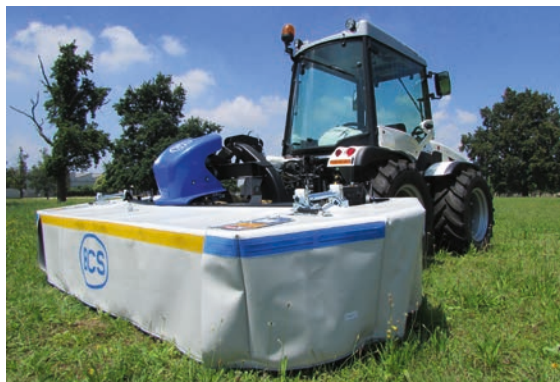
Falciatrice Rotex Edelweiss.

Passando alla manutenzione professionale del verde, la gamma di macchine Ma.Tra. by Bcs si amplia con l'introduzione sul mercato della nuova Ma.Tra. 250 , una semovente con piatto frontale concepita per il taglio e la raccolta dell'erba di aree verdi, parchi pubblici e privati, campi sportivi e per tutti i lavori tipici delle municipalità. La Ma.Tra. 250 monta un motore da 29,4 cv di potenza e una