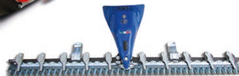
Barra falciante Dual Laser Elasto.

trasmissione con ingranaggi in bagno d'olio e di una struttura in solido acciaio che ne garantisce la durata nel tempo, il monorotore di taglio è fissato su cuscinetti che sopportano senza problemi anche le più tenaci sollecitazioni.