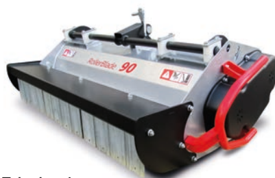
Trinciaerba Roller Blade 90.

trasmissione idrostatica a variazione continua con una gamma di velocità da 0 a 15 km/h. L'apparato falciante frontale con larghezza di taglio da 132 cm è dotato di due lame controrotanti con estremità pivottanti antiurto. L'altezza di taglio è regolabile in maniera 'continua' da 20 a 110 mm. Il cesto di raccolta da 950 litri di volume ha il sollevamento e il ribaltamento idraulico a 2 m di altezza. Sempre in tema di manutenzione del verde troviamo il trinciaerba monorotore a coltelli mobili RollerBlade , disponibile da 75 e 90 cm di larghezza, l'attrezzo ideale per la manutenzione 'heavy duty' di terreni incolti, sottobosco e parchi rustici anche in zone declive. Dotato di